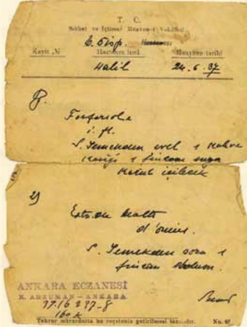
1937 yılında Ankara'daki bir eczanede işleme konmuş bir Türkçe reçete örneği: Fosfarsol [Kuvvet ilacı]. Yemeklerden evvel 1 kahve kaşığı 1 fincan suya katılıp içilecek. (Kaynak: Gülnur-Mert Sandalci, Belgelerle Türk Eczacılığı II , 1998)