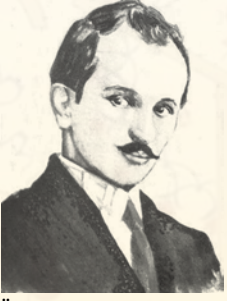
Ömer Seyfettin (1884-1920)

Bu satırların yazarından başka kim bilir kaç kuşağın çocukluğu daha iki Türk yazarının tuhaf, hüznü ve yer yer korkutucu kitaplarını okuyarak geçti? İlki Küçük Besleme , Öksüz Murat , Karalıkta Bir Çocuk , Annesizler , Babasızlar , Sakat Çocuk , Kolsuz Bebek gibi adı bile ürkütücü kitapların yazarı Kemalettin Tuğcu (1902-1996), ikincisi ise özellikle tarihi konuları ele aldığı öykülerinde ne yapıp edip kanlı bir sahne yaratmaktaki ustalığıyla; gövdesi, kesik başını almak için ayağa kalkıp var gücüyle savaşıyor, kocasının kesik başının sarılı olduğu kılıfı bomba zanneden ya da diyetini ödemek için satırla kendi kolunu kesen kahramanların yaratıcısı Ömer Seyfettin (1884-1920). Tuğcu'yu bilmem ama Ömer Seyfettin'in Türk öykü sanatımızdaki eşsiz yeri ve dilde sadeleşme için gösterdiği olağanüstü çabalarıyla gelecek kuşaklar tarafından da hatırlanacağından eminim.